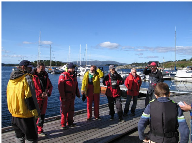
Premieutdeling på Hjellestad etter fullført Lerøy Rundt 2009.