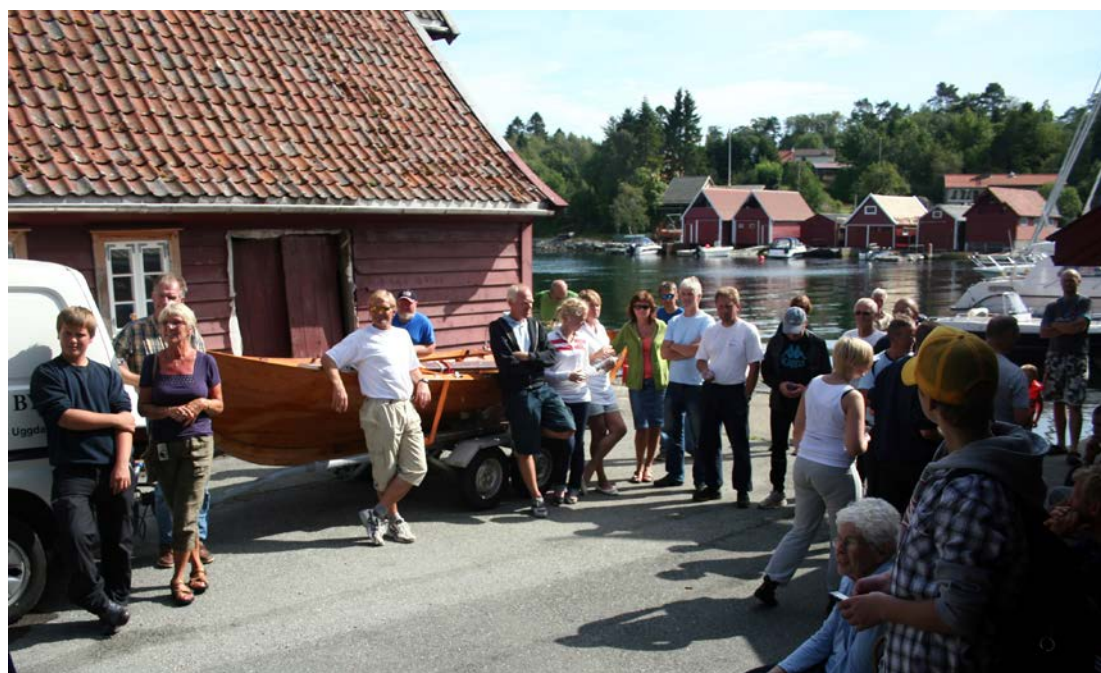
I det fine været var det trivelig å være tilskuer ved premieutdelingen.