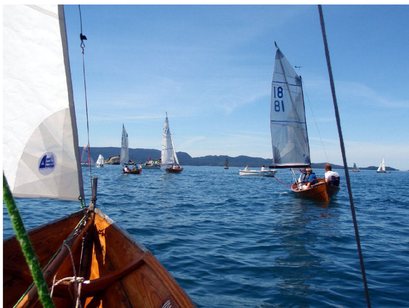
Fra Sommerregatta på Tysnes lørdag 27. juni 2009.