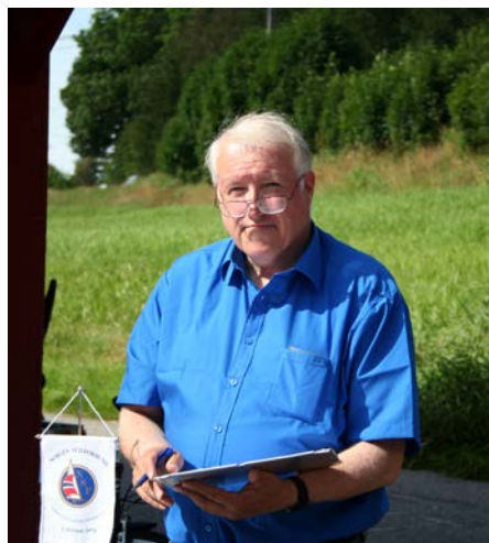
Regattasjefen oppsummerer NM.