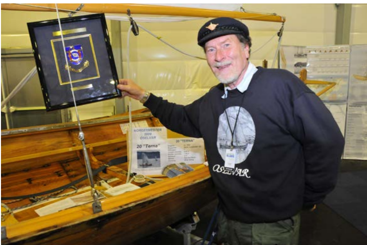
Nasjonalbåttrofeet ble vist frem på båtmessen "Dra til Sjøen" i Aremum. Her henger trofeet under storseilbommen på "Terna", norgesmester i NM Oselvar 2009.